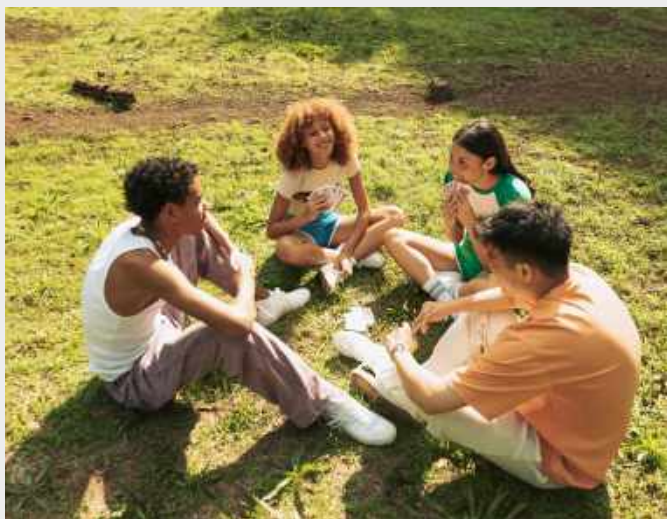
กิจกรรมเข้าค่าย เยาวชน รุ่นที่ 20