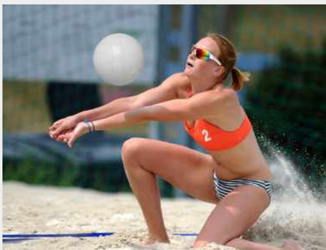
กิจกรรมการแข่งขัน วอลเลย์บอล ภาคเรียนที่ 1