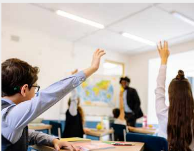
กิจกรรมเพิ่มทักษะภาษาอังกฤษ