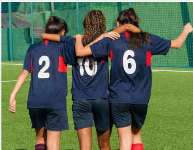
เข้าร่วมกิจกรรมแข่งขัน ฟุตบอลประจำโรงเรียน