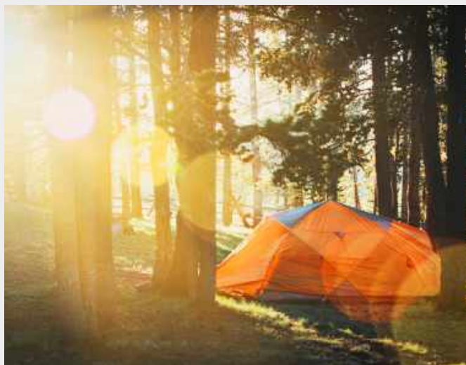
กิจกรรมเข้าค่าย เยาวชน รุ่นที่ 21