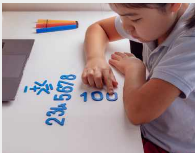
กิจกรรมเพิ่มทักษะคณิตศาสตร์