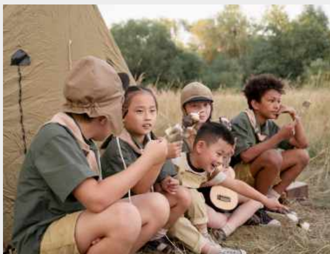
กิจกรรมเข้าค่าย ลูกเสือ ครั้งที่ 11