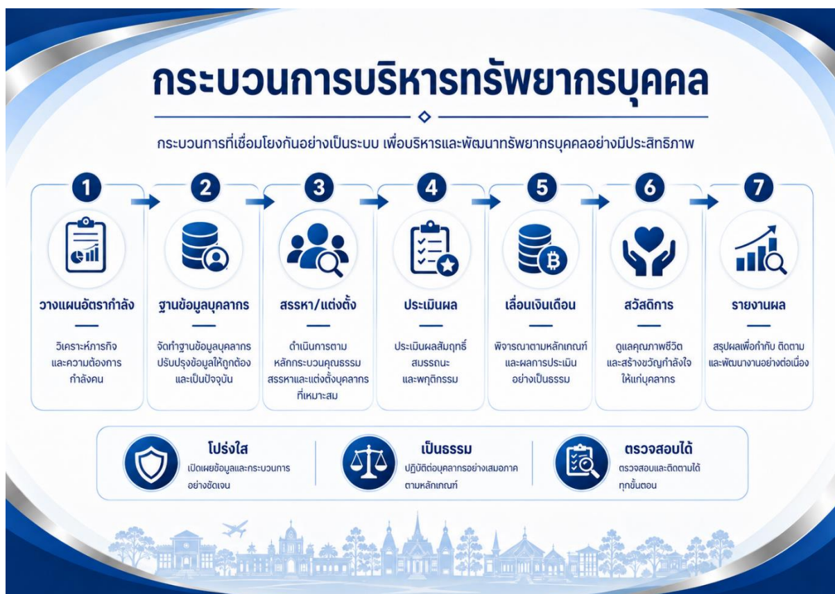
กระบวนการบริหารทรัพยากรบุคคล

ในปีงบประมาณ พ.ศ. 2568 มหาวิทยาลัยกาฬสินธุ์ได้ดำเนินงานด้านการบริหารทรัพยากรบุคคลภายใต้หลักระบบคุณธรรม หลักธรรมาภิบาล ความโปร่งใส ความเสมอภาค ความคุ้มค่า และการมุ่งผลสัมฤทธิ์ขององค์กร โดยคำนึงถึงความสอดคล้องกับแผนยุทธศาสตร์มหาวิทยาลัย แผนบริหารและพัฒนาทรัพยากรบุคคล กฎหมาย ระเบียบ ข้อบังคับ และประกาศที่เกี่ยวข้องกับการบริหารงานบุคคลของสถาบันอุดมศึกษา