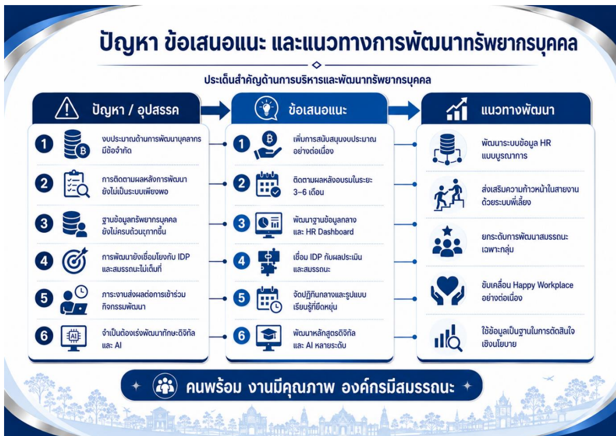
ปัญหา อุปสรรค และแนวทางการพัฒนาทรัพยากรบุคคล

การวิเคราะห์ปัญหา อุปสรรค และข้อเสนอแนะในส่วนนี้ พิจารณาจากผลการดำเนินงาน ประจำปีงบประมาณ พ.ศ. 2568 ประกอบกับประเด็นปัญหาและข้อเสนอแนะจากรายงานปีที่ผ่านมา ซึ่งเคยสะท้อนข้อจำกัดสำคัญ เช่น งบประมาณ ระบบสารสนเทศทรัพยากรบุคคล การติดตามผลการพัฒนาบุคลากร ความท้าทายด้านการประสานงาน และการลงทุนด้านเทคโนโลยี รวมทั้งข้อมูลโครงการ/กิจกรรมปี 2568 ที่แสดงให้เห็นว่ามหาวิทยาลัยมีการดำเนินโครงการด้านการพัฒนาศักยภาพทรัพยากรบุคคล องค์กรแห่งความสุข จริยธรรม ภาวะผู้นำ และการพัฒนาระบบงานหลายรายการ