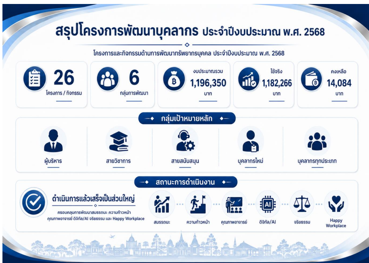
ผลการดำเนินงานโครงการและกิจกรรมพัฒนาทรัพยากรบุคคล

โครงการสำคัญที่เกี่ยวข้องกับการพัฒนาทรัพยากรบุคคล ปรากฏในกลุ่ม Project 15: โครงการพัฒนาศักยภาพทรัพยากรบุคคล และ Project 16: โครงการองค์กรแห่งความสุข (Happy Workplace) รวมถึงกิจกรรมสนับสนุนด้านจริยธรรม ภาวะผู้นำ วัฒนธรรมองค์กร และคุณภาพชีวิตบุคลากร