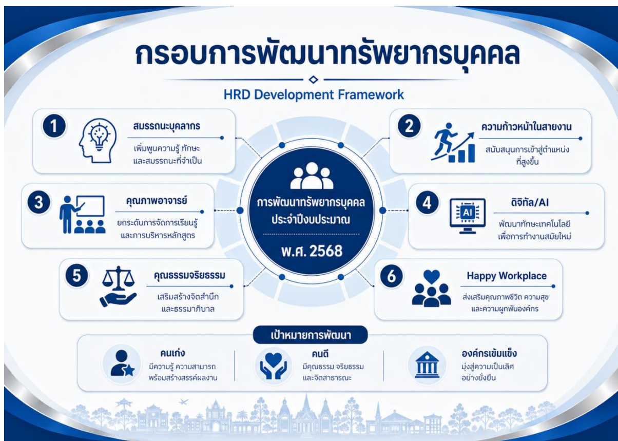
กรอบการพัฒนาทรัพยากรบุคคล

ในปีงบประมาณ พ.ศ. 2568 มหาวิทยาลัยกาฬสินธุ์ได้ดำเนินโครงการและกิจกรรมด้านการพัฒนาทรัพยากรบุคคลภายใต้ประเด็นการพัฒนาที่เกี่ยวข้องกับการบริหารงานที่นำสมัย มีธรรมาภิบาล และสร้างระบบนิเวศแห่งคุณภาพ โดยเฉพาะกลุ่มโครงการพัฒนาศักยภาพทรัพยากรบุคคล และโครงการองค์กรแห่งความสุข ซึ่งมีเป้าหมายเพื่อยกระดับสมรรถนะบุคลากร ส่งเสริมความก้าวหน้าในสายงาน พัฒนาคุณภาพชีวิต เสริมสร้างคุณธรรมจริยธรรม และสร้างวัฒนธรรมองค์กรที่เอื้อต่อการทำงานอย่างมีประสิทธิภาพ