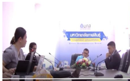
อธิการบดีมหาวิทยาลัยกาฬสินธุ์

รูปคณะกรรมการเงินรายได้ของมหาวิทยาลัยกาฬสินธุ์ ครั้งที่ ๑/๒๕๖๗ วันพุธ ที่ ๓ เมษายน พ.ศ. ๒๕๖๗ เวลา ๐๙.๓๐ น. ณ ห้องประชุม ๖๐๓ ชั้น ๖ อาคารสำนักงานอธิการบดีและบริหารสินทรัพย์ มหาวิทยาลัยกาฬสินธุ์ พื้นที่ในเมือง และการประชุมผ่านสื่ออิเล็กทรอนิกส์ Zoom meeting